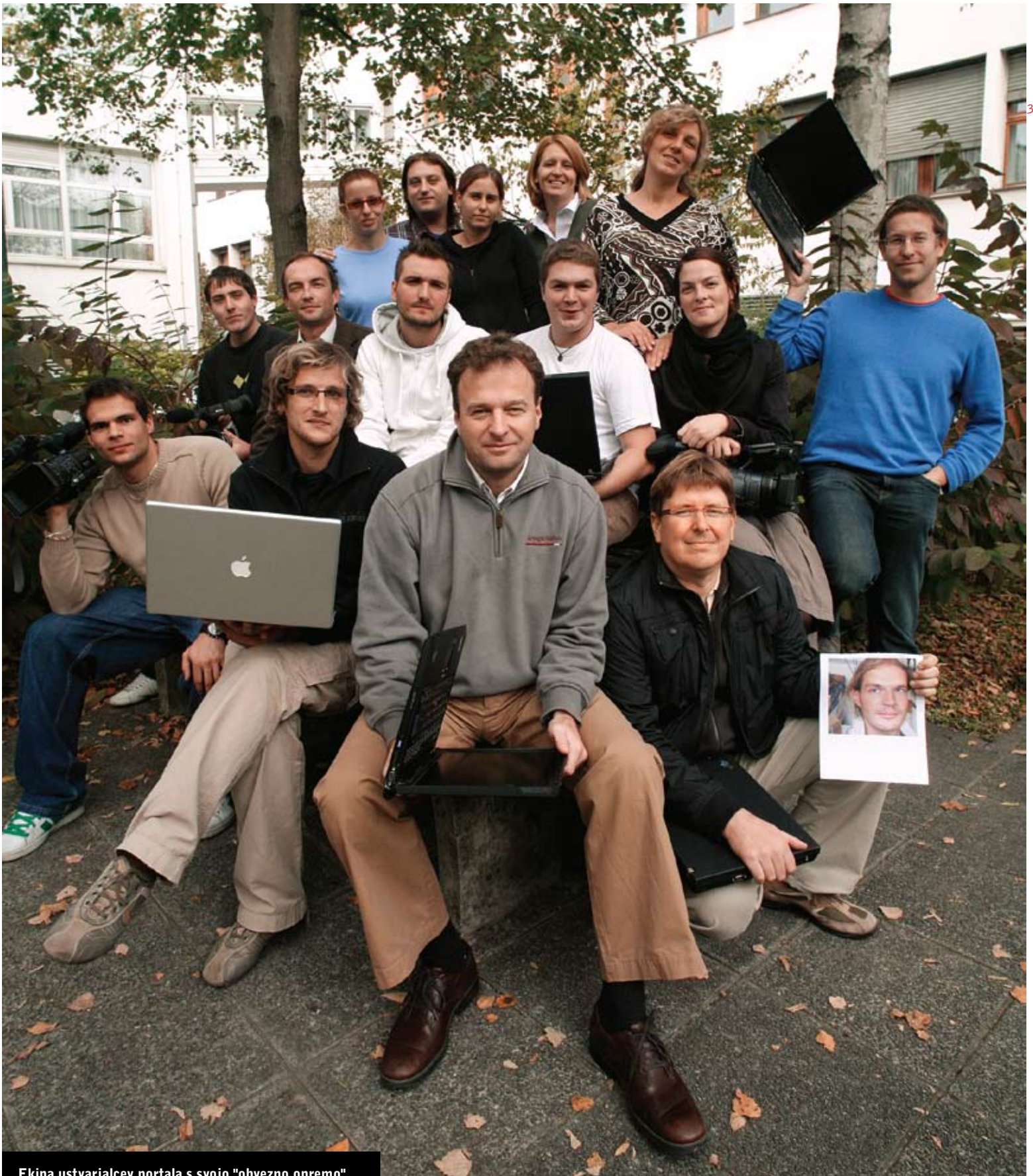
Ekipa ustvarjalcev portala s svojo "obvezno opremo"

profesor odpovedal predavanja in študentom naročil, naj si ogledajo neko predavanje na portalu. Profesorji na novo odkrivajo čut za samokritičnost. »Zgodi se, da predavatelji gledajo svoje predavanje in si rečejo: 'Kako zanič predavam, moram se popraviti. Predavam staro šaro.' Opazili