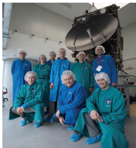
Slika 3: Zmagovalna ekipa ESA Mars Express Power Challenge na obisku v Esinem Centru za nadzor vesoljskih odprav (ESOC) v Darmstadtu.

pri dolgoročni presoji vzdržne proizvodnje električne energije v Sloveniji in pri presoji mogoče prisotnosti gensko spremenjenih organizmov v hrani in krmi na osnovi podatkov o sledljivosti (projekt DECATHLON). Na vsakem od teh področij smo razvili tudi pripadajoči sistem za podporo pri odločanju. Našo kvalitativno večkriterijsko metodo odločitvenega modeliranja DEX