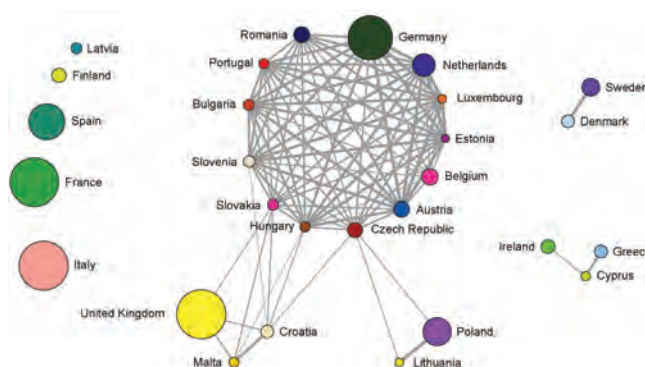
Slika 1: Omrežje EU držav, povezanih z vzajemnim deljenjem twitov. Velikost vozlišča je sorazmerna s številom članov Evropskega parlamenta iz posamezne države. Omrežje vsebuje veliko povezano komponento 18 držav z jedrom 13 tesno povezanih držav okrog Nemčije.

Naša ekipa je zmagala na tekmovanju Evropske vesoljske agencije ESA Mars Express Power Challenge z zasnovo najboljše rešitve za napovedovanje porabe električne energije na vesoljski sondi.