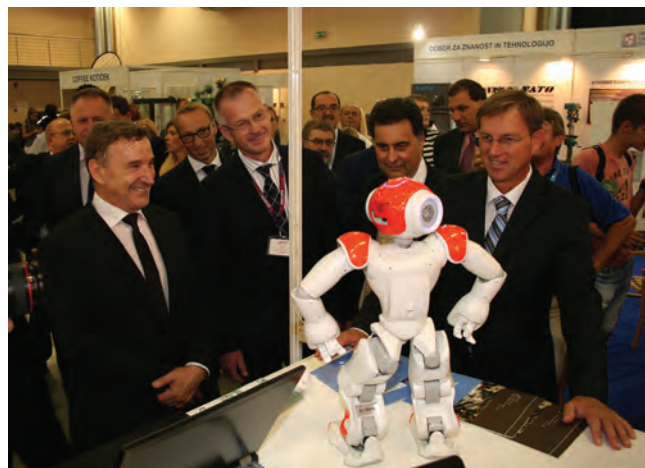
Slika 4: Naš zgovorni robot NAO WHIMBOT je pritegnil veliko pozornosti na Mednarodnem sejmu obrti in podjetnosti v Celju.

Leta 2016 smo organizirali deseto konferenco Jezikovne tehnologije, ki smo jo v tem letu razširili na področje digitalne humanistike. Konferenca je potekala na Filozofski fakulteti Univerze v Ljubljani v več paralelnih sekcijah.